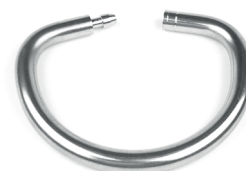
[99801] Sleutelring Ø 30 mm - 4 mm